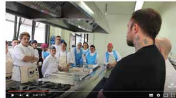
Street Food Academy. Chef Rubio fa lezione ai ragazzi... 1.041 visualizzazioni